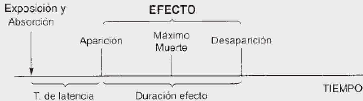
Figura 2.2. Distintos tiempos en un proceso tóxico.