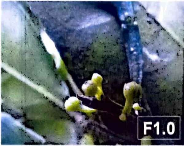
TABLA PARA RECONOCIMIENTO DE ESTADIOS FENOLÓGICOS EN CITRICOS - FLORACION